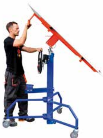
MONTÁŽ ZKOSENÉ STŘECHY